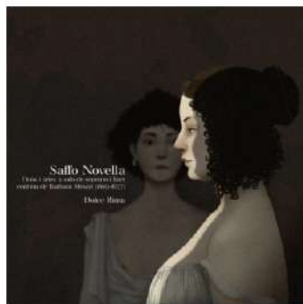
Portada de Saffo Novella.

Han pasado casi diez años desde que el dúo Dolce Rima lanzó su primer álbum, Al alba venid (2013), un trabajo que abordaba, con una frescura y gracia inusitadas, piezas del Renacimiento español. Estos días finales del año hemos podido conocer su segundo trabajo dedicado a la obra y la persona de la grandísima compositora barroca Barbara Strozzi . Y hay que decir que la espera ha merecido la pena, y con creces. Los once temas de la veneciana incluidos en el disco danlumban en su cometido de reflejar toda la belleza explosiva que emana su creación, y que la sitúan, sin lugar a dudas, en uno de los lugares más destacados dentro de la música del Seicento italiano.